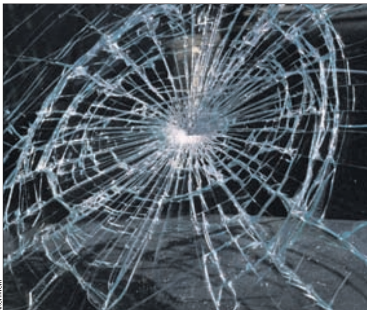
W jednym z pojazdów zbil przednią szybę