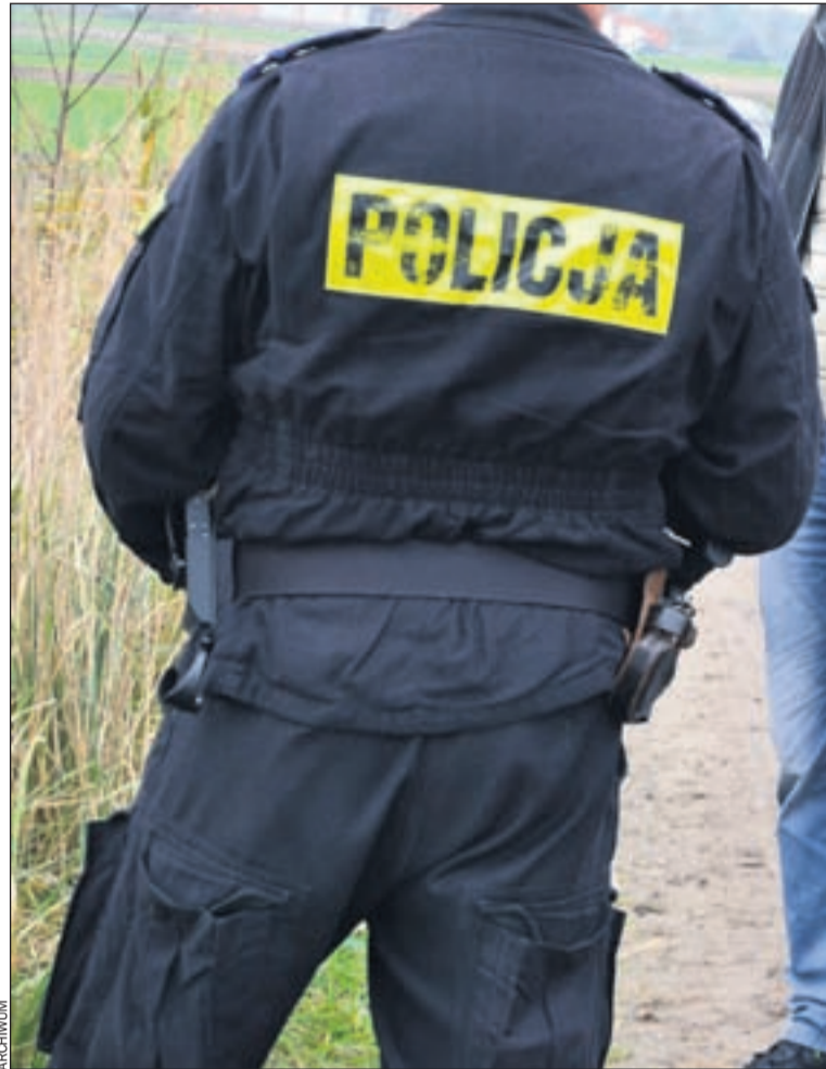
Śledczy ustalają, z jakiego powodu nastąpiły zgony obu mężczyzn